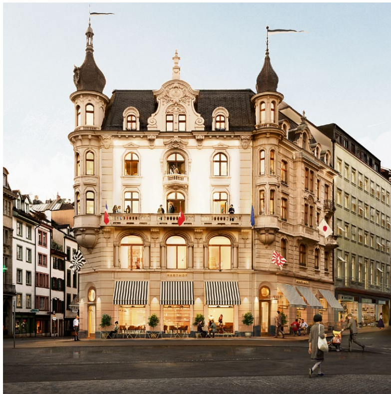
So soll das neue Hotel am Marktplatz aussehen.

Der Beginn der Umbauarbeiten ist für nächste Woche angesetzt. Ein Boutique-Hotel zeichnet sich durch individuelle Raumgestaltung aus und ist normalerweise im oberen Komfortsegment angesiedelt. Die Baubewilligung für das Vorhaben liegt vor, wie es weiter heisst. Weitere Details zum Umbau würden zu einem späteren Zeitpunkt kommuniziert. 20M